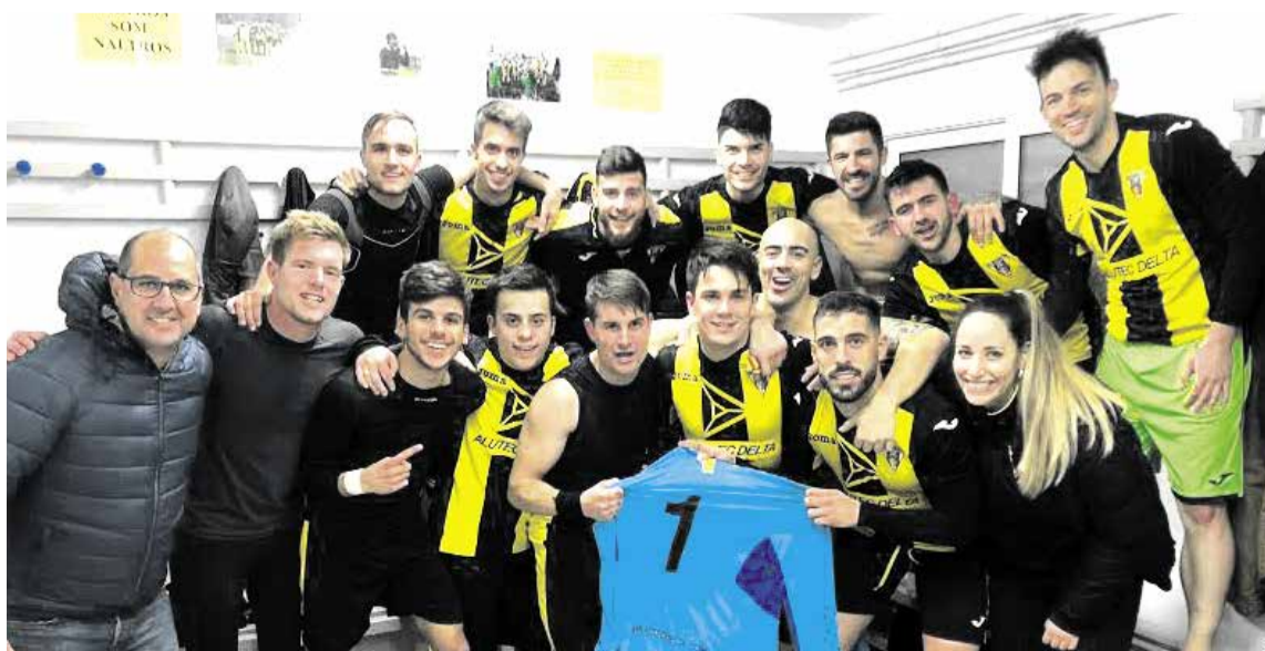
El Perelló, celebrant la victòria en acabar el partit, diumenge, al vestidor.