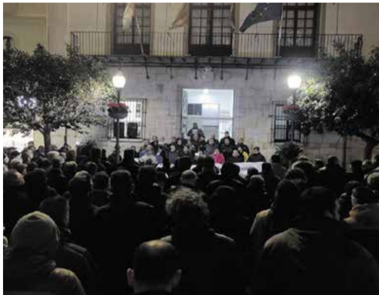
Manifestació de dilluns a Alcanar, una de les tres que van fer-se al territori.