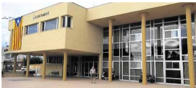
Imatge d'arxiu de l'Ajuntament de Deltebre.

Des d'aquesta mateixa setmana s'ha obert el període per sol·licitar el conjunt d'ajudes i subvencions que l'Ajuntament posa a l'abast de la ciutadania, dels comerços i del teixit associatiu per al 2019.