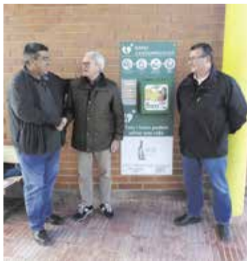
Un dels desfibril·ladors instal·lats.

L a recent instal·lació de tres desfibril·ladors, sumats al que ja porta la Policia Local al seu vehicle, fan que Sant Jaume d'Enveja es converteixi en municipi cardioprotegit.