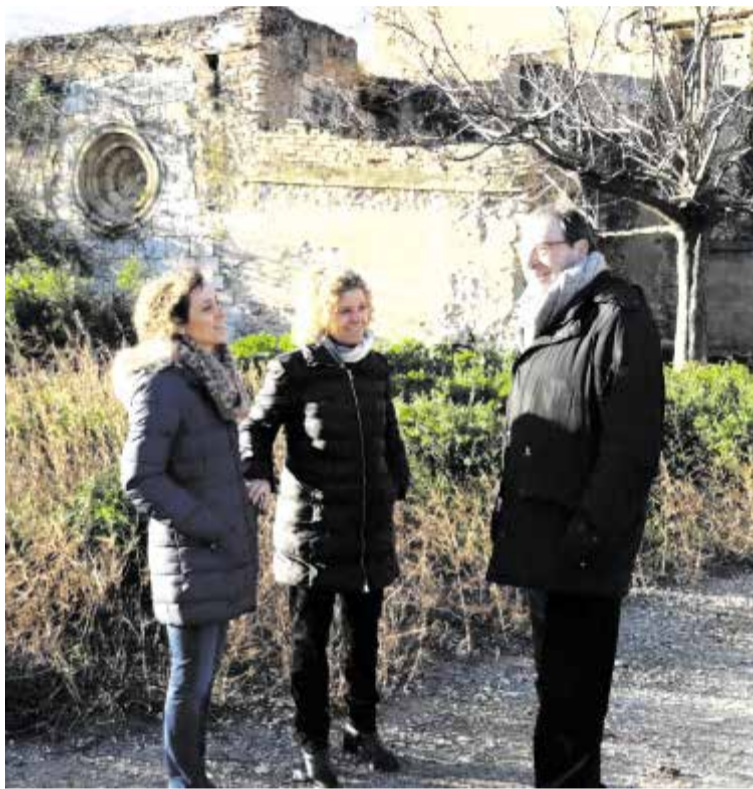
Visita al Mas de Bisbe, aquesta setmana.

L' Ajuntament i el Bisbat de Tortosa han arribat a un acord per a la compra del conegut com a Mas del Bisbe, a Bitem.