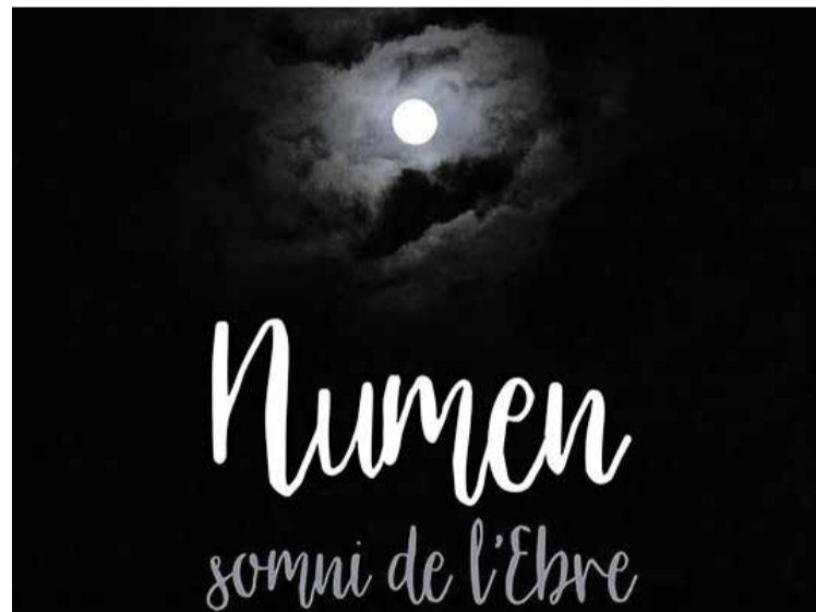
Cartell promocional de 'Numen, somni de l'Ebre'.

L'acte estarà presidit per la consellera de Cultura de la Generali-