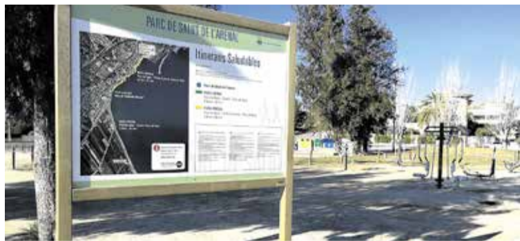
Cartellera al parc de salut.

L 'Ajuntament de l'Ampolla ha posat en marxa dos itineraris saludables que recorren part de la seva costa, ambdós s'inicien i finalitzen al parc de salut de l'Arenal.