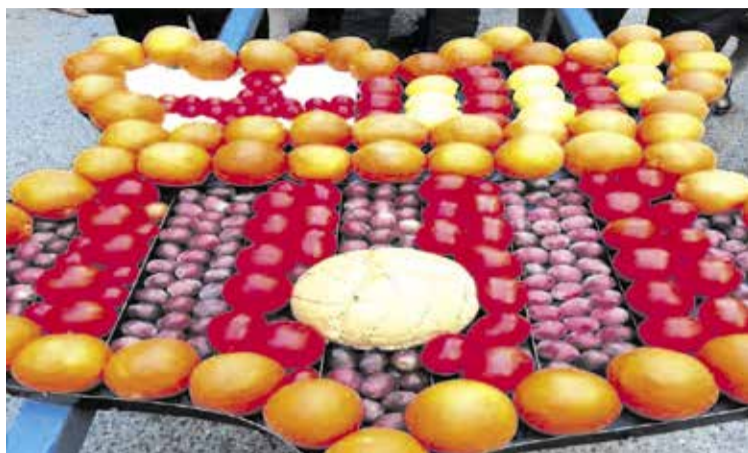
La Penya Barcelonista a l'ofrena al patró, amb un escut del Barça de fruita.

A les 19 hores, està prevista la recepció de les penyes participants al local social de la Penya Barcelonista (Hotel d'Entitats del