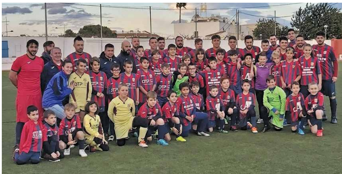
Formacions del Móra la Nova i, baix, del CF Santa Bàrbara el dia de la presentació.