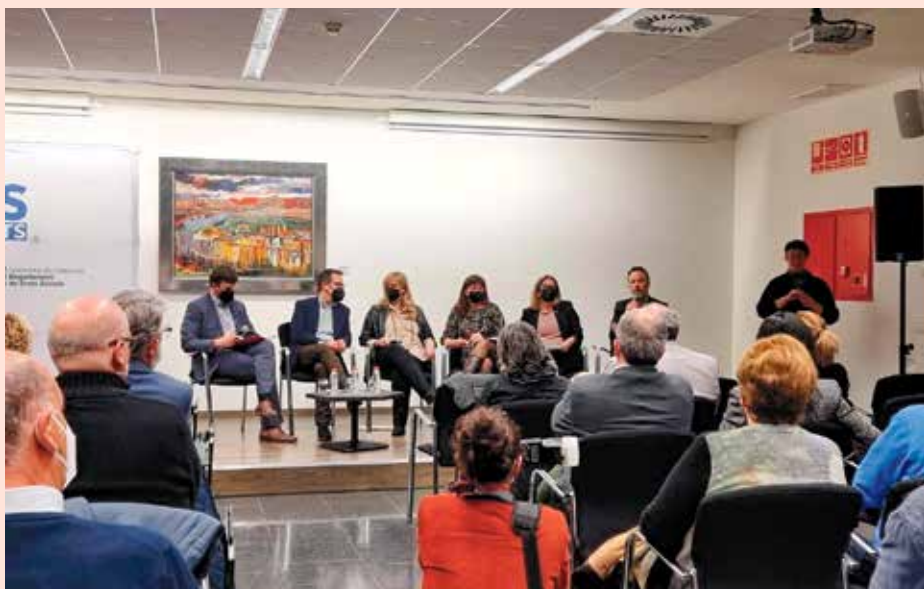
La conferència Més drets, més oportunitats, que va tenir lloc a la Universitat Rovira i Virgili, va aplegar representants d'entitats socials, col·legis professionals i món local.