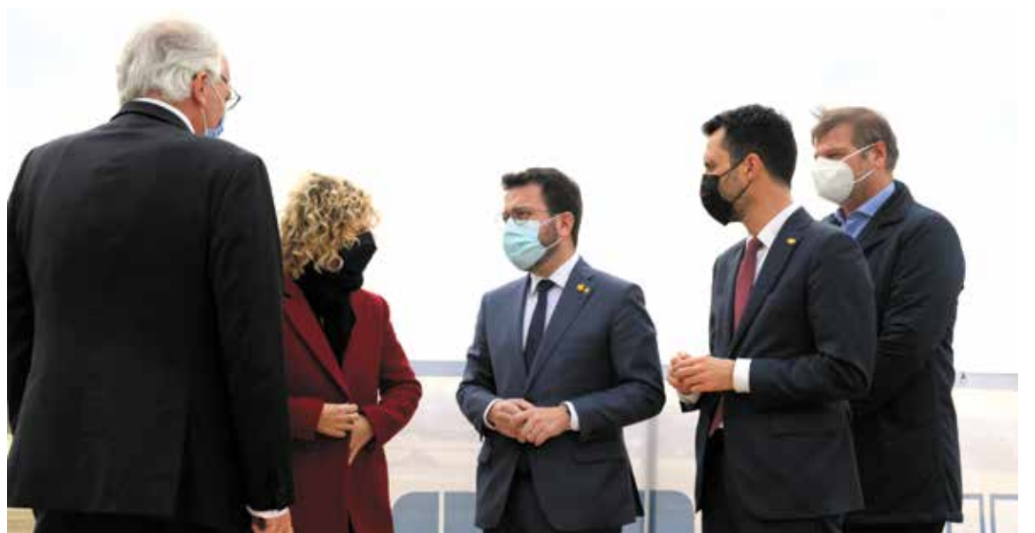
El president de la Generalitat, Pere Aragonès, en la seua visita al polígon Catalunya Sud.

El polígon Catalunya Sud ha tingut importants inversions en els últims mesos i anys i el president de la Generalitat, Pere Aragonès, l'ha posat com a exemple de la "reindustrialització verda, digital i d'economia circular que necessita el país". Aragonès també ha agraït l'aposta per Catalunya i les Terres de l'Ebre amb la inversió "d'un volum considerable