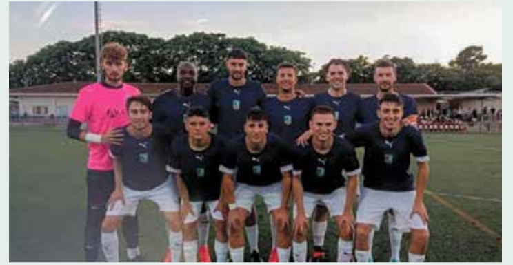
Formació del CF la Sénia, en el darrer partit de Copa.

Tret de sortida aquest cap de setmana a les competicions des de Lliga Elit fins la quarta catalana i també al futbol base.