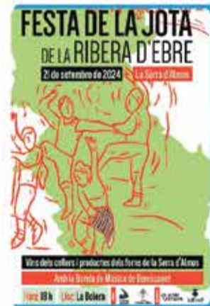
La Serra d'Almos