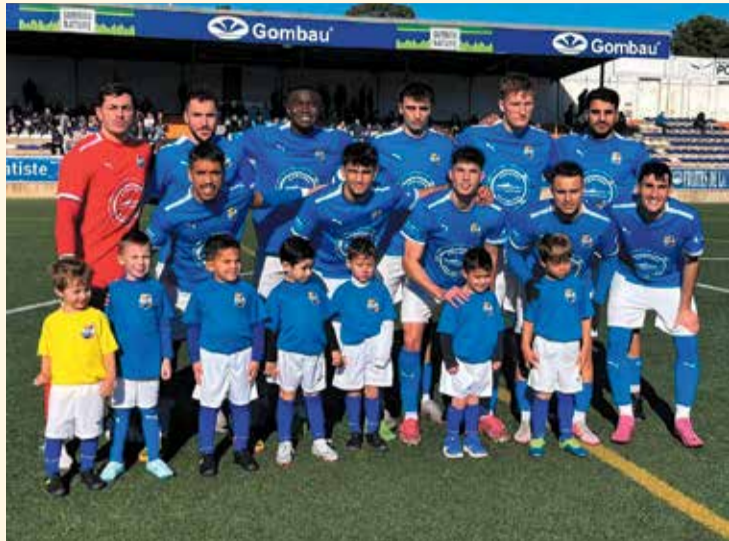
Formació inicial de Rapitenca, diumenge passat, en el partit contra el Castelldefels