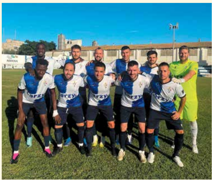
Una formació del Masdenverge, de Tercera catalana, d'esta temporada.