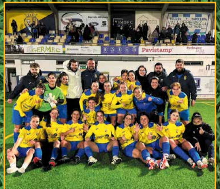
UE Aldeana femení, líder de la segona divisió.