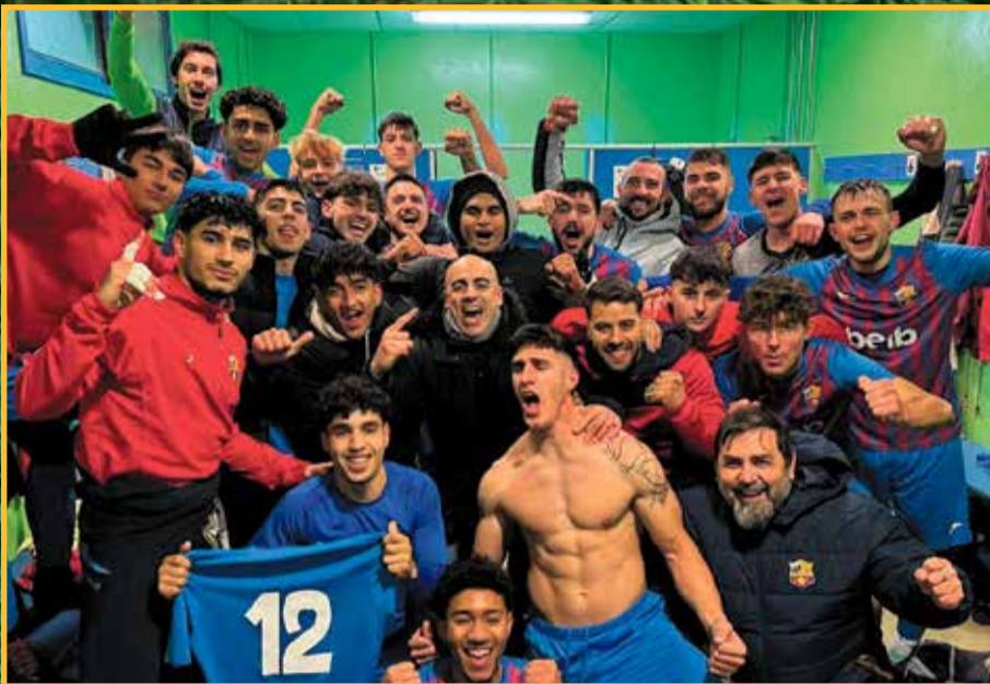
CF Santa Bàrbara: en línia ascendent.