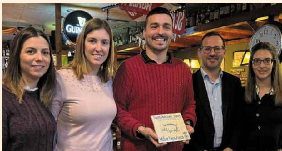
MÓRA D'EBRE: Entrega del reconeixement a la Birreria per la millor tapa de la Ruta de la Tapa Porca.