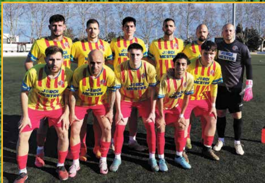
Formació CD Roquetenc, diumenge al camp de la Cava, on va guanyar al líder.