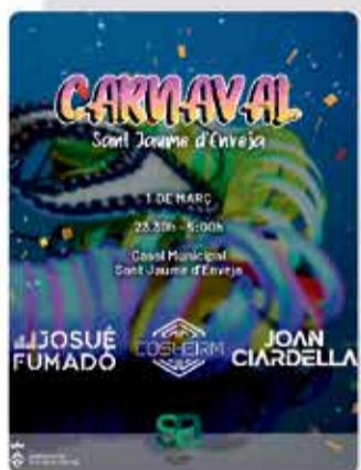
Sant Jaume d'Enveja