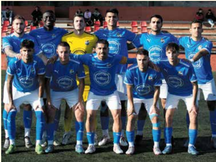
Formació de la UE Rapitenca, diumenge al Vilar de Valls.