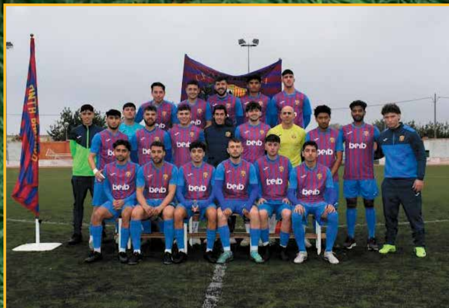
El Santa Bàrbara va fer la presentació dels equips, la setmana passada.