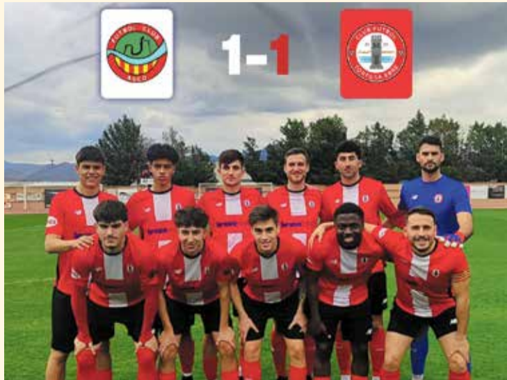
Formació del Tortosa Ebre, dissabte en el partit de recuperació al camp de l'Ascó (1-1).