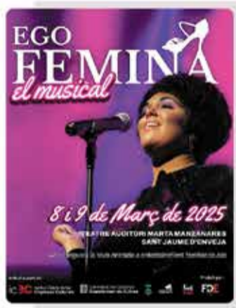
Sant Jaume d'Enveja