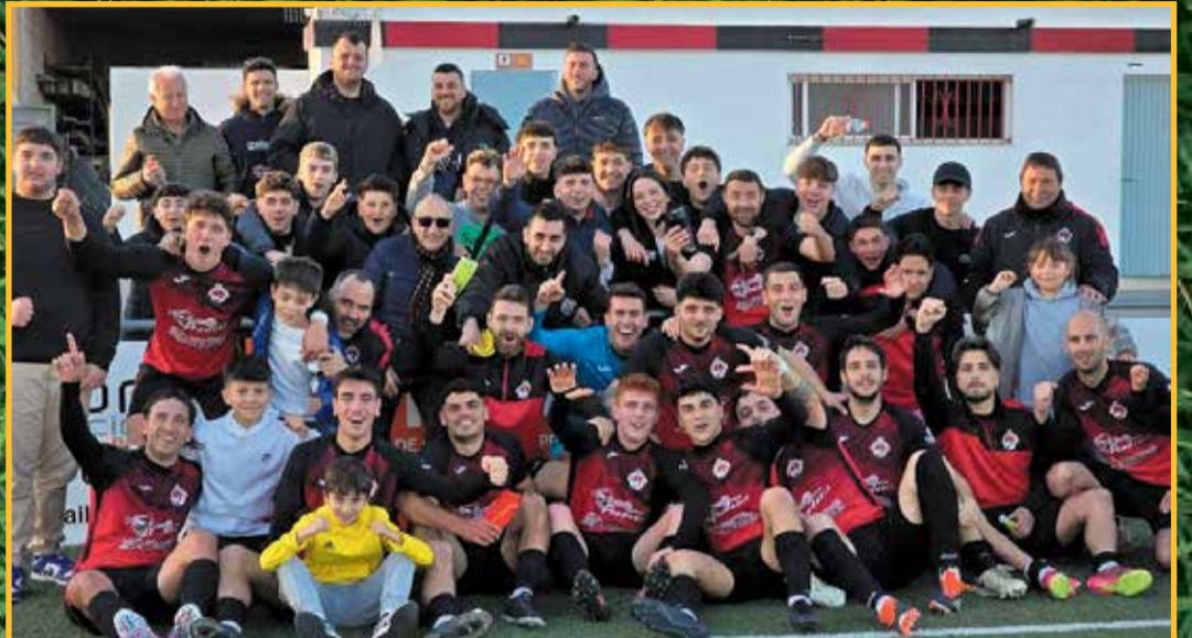
L'Ampolla va golejar el Perelló en el derbi i viu ara un bon moment, millorant i buscant l'objectiu que és acabar dels cinc primers.