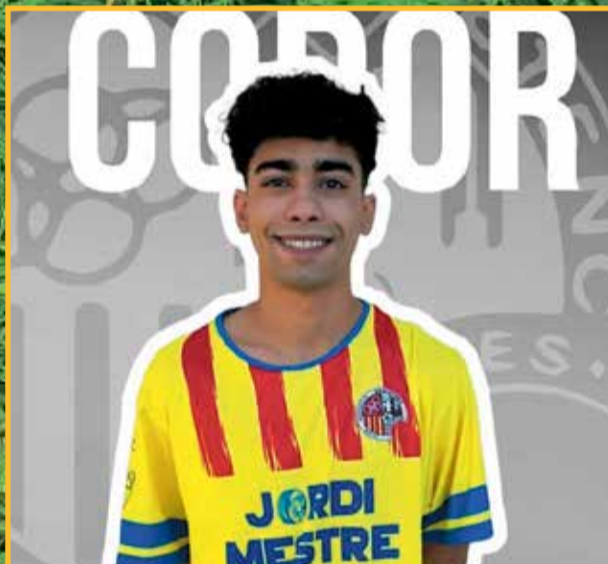
Un jugador només havia marcat dos gols fins ara i dissabte en va marcar cinc. Es diu Codor i juga al Roquetenc. Gairebé podia ser cosí germà de Lamine Yamal, per la semblança.