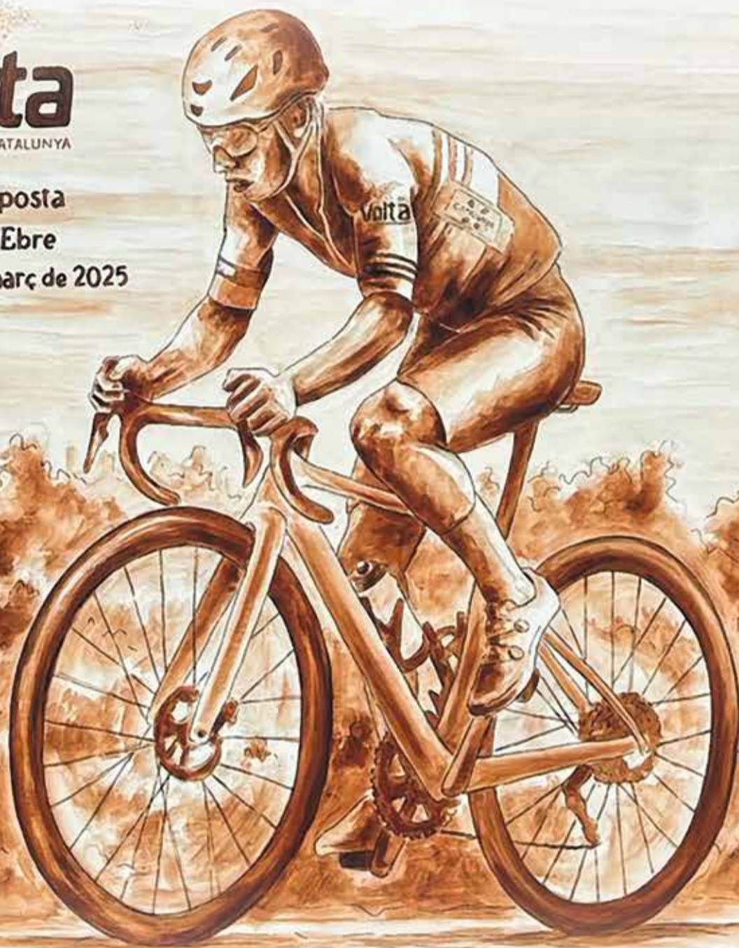
Foto: Ajuntament de Paüls · Autor: Domingo Basco · Muntatge: Jesús Ruiz

Paüls - Amposta Terres de l'Ebre Divendres, 28 de març de 2025