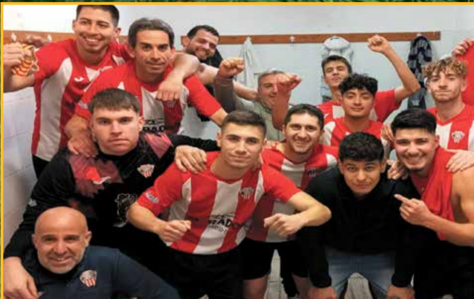
El Jesús i Maria B, cuer de Tercera, va donar la campanada contra el líder la Cava, equip que va empatar en el temps afegit.