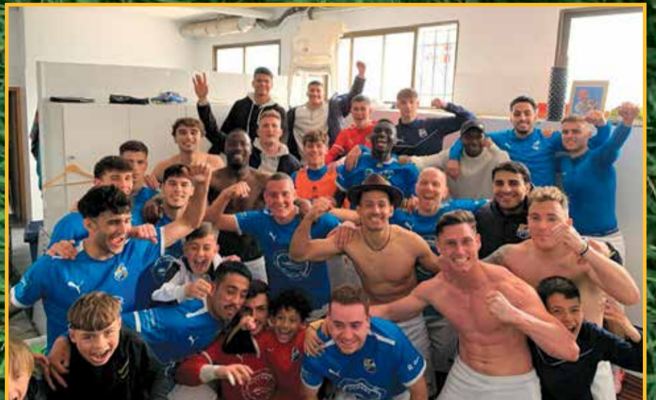
Celebracions de la Rapitenc al vestidor, diumenge després de guanyar el Can Vidalet.