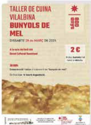
Vilalba dels Arcs