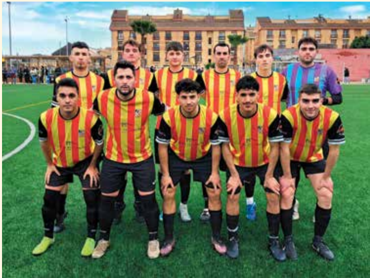
Formació de l'Horta que dissabte va guanyar a Campredó (0-1).